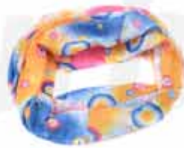
BANDANA NECK CUSTOMIZABLE 100% POLYESTER BANDANA NECK