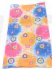
BANDANA NECK CUSTOMIZABLE 100% POLYESTER BANDANA NECK