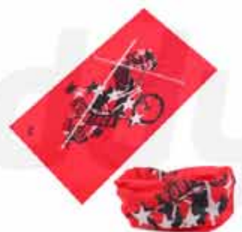
BANDANA NECK CUSTOMIZABLE 100% POLYESTER BANDANA NECK