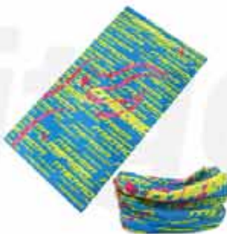
BANDANA NECK CUSTOMIZABLE 100% POLYESTER BANDANA NECK