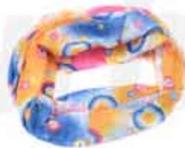
BANDANA NECK CUSTOMIZABLE 100% POLYESTER BANDANA NECK