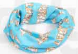
BANDANA NECK CUSTOMIZABLE 100% POLYESTER BANDANA NECK