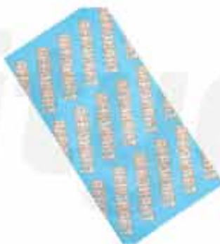
BANDANA NECK CUSTOMIZABLE 100% POLYESTER BANDANA NECK