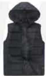
MEN'S HOODED INSULATED JACKET CUSTOMIZABLE JACKET. GREAT FOR LATE FALL AND EARLY WINTER. THIS WATER-RESISTANT JACKET FEATURES A THERMAL LINING AND INSULATION FOR EXTRA WARMTH.