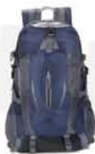
20 LITERS OUTDOOR BACKPACK

CUSTOMIZABLE 20 LITERS OUTDOOR BACKPACK MADE OF OXFORD CLOTH WITH JAGUARD TECHNIQUE WATERPROOF RESISTANT TO ANY SITUATION