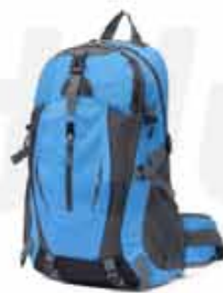
20 LITERS OUTDOOR BACKPACK

CUSTOMIZABLE 20 LITERS OUTDOOR BACKPACK MADE OF OXFORD CLOTH WITH JAGUARD TECHNIQUE WATERPROOF RESISTANT TO ANY SITUATION