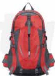
20 LITERS OUTDOOR BACKPACK

CUSTOMIZABLE 20 LITERS OUTDOOR BACKPACK MADE OF OXFORD CLOTH WITH JAGUARD TECHNIQUE WATERPROOF RESISTANT TO ANY SITUATION