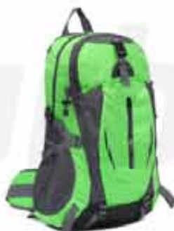
20 LITERS OUTDOOR BACKPACK

CUSTOMIZABLE 20 LITERS OUTDOOR BACKPACK MADE OF OXFORD CLOTH WITH JAGUARD TECHNIQUE WATERPROOF RESISTANT TO ANY SITUATION