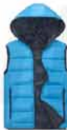
MEN'S HOODED INSULATED JACKET CUSTOMIZABLE JACKET. GREAT FOR LATE FALL AND EARLY WINTER. THIS WATER-RESISTANT JACKET FEATURES A THERMAL LINING AND INSULATION FOR EXTRA WARMTH.