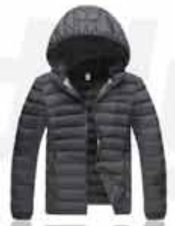
MEN'S HOODED INSULATED JACKET CUSTOMIZABLE JACKET. GREAT FOR LATE FALL AND EARLY WINTER. THIS WATER-RESISTANT JACKET FEATURES A THERMAL LINING AND INSULATION FOR EXTRA WARMTH.