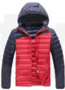
MEN'S HOODED INSULATED JACKET CUSTOMIZABLE JACKET. GREAT FOR LATE FALL AND EARLY WINTER. THIS WATER-RESISTANT JACKET FEATURES A THERMAL LINING AND INSULATION FOR EXTRA WARMTH.