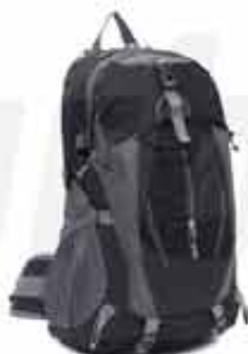
20 LITERS OUTDOOR BACKPACK

CUSTOMIZABLE 20 LITERS OUTDOOR BACKPACK MADE OF OXFORD CLOTH WITH JAGUARD TECHNIQUE WATERPROOF RESISTANT TO ANY SITUATION