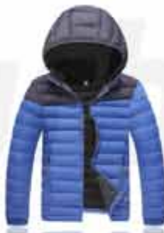
MEN'S HOODED INSULATED JACKET CUSTOMIZABLE JACKET. GREAT FOR LATE FALL AND EARLY WINTER. THIS WATER-RESISTANT JACKET FEATURES A THERMAL LINING AND INSULATION FOR EXTRA WARMTH.