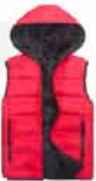
MEN'S HOODED INSULATED JACKET CUSTOMIZABLE JACKET. GREAT FOR LATE FALL AND EARLY WINTER. THIS WATER-RESISTANT JACKET FEATURES A THERMAL LINING AND INSULATION FOR EXTRA WARMTH.