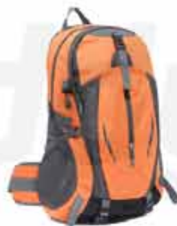
20 LITERS OUTDOOR BACKPACK

CUSTOMIZABLE 20 LITERS OUTDOOR BACKPACK MADE OF OXFORD CLOTH WITH JAGUARD TECHNIQUE WATERPROOF RESISTANT TO ANY SITUATION