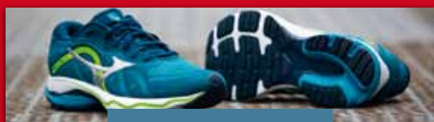
Mizuno Ultima 13