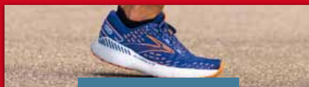
Brooks Glycerin 20